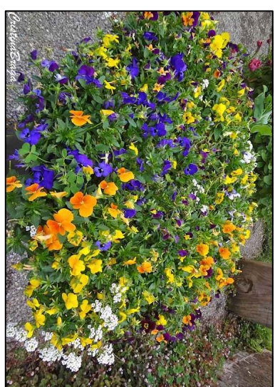
AMOR-PERFEITO-DOS-JARDINS 7 Viola tricolor