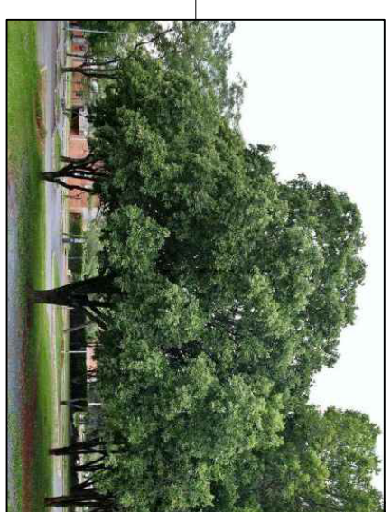
OITI 6 Licania tomentosa